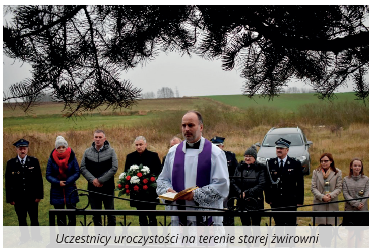
Uczestnicy uroczystości na terenie starej żwirowni