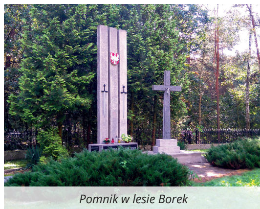
Pomnik w lesie Borek

Wspomnieniem tego tragicznego wydarzenia i hołdem dla ofiar była modlitwa oraz złożenie okolicznościowych wiązanek kwiatów i zniczy przed pomnikiem upamiętniającym to wydarzenie w lesie Borek koło Lubawy.