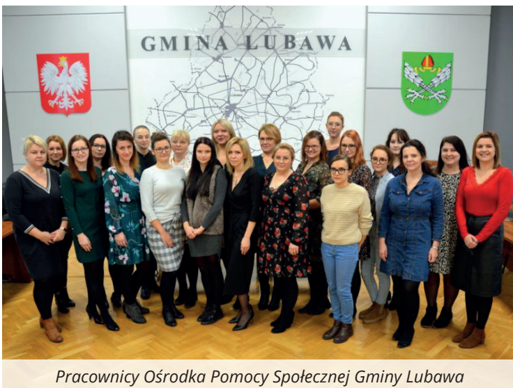
Pracownicy Ośrodka Pomocy Społecznej Gminy Lubawa