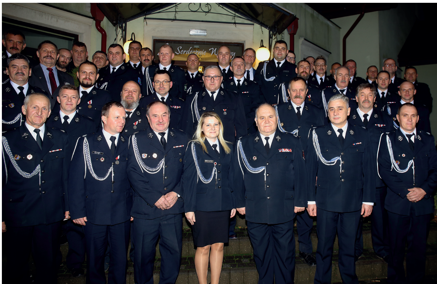
Uczestnicy Zjazdu Oddziału Gminnego Związku Ochotniczych Straży Pożarnych RP w Lubstynku

Uczestnicy zapoznali się ze wszystkimi sprawozdaniami, a na wniosek ustępującej Gminnej Komisji Rewizyjnej jednomyślnie udzielono absolutorium ustępującemu zarządowi.