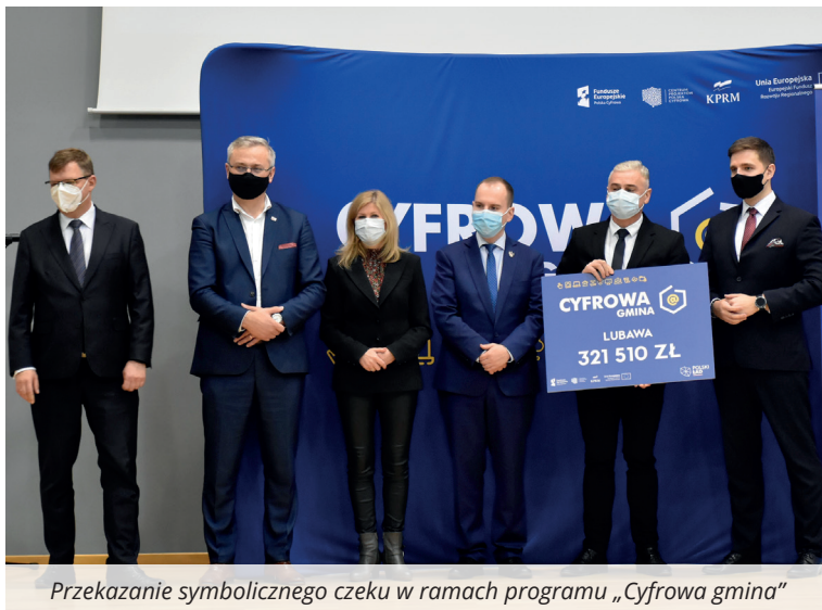
Przekazanie symbolicznego czeku w ramach programu „Cyfrowa gmina”

Do gminy Lubawa trafi 321 tys. 510 zł w formie grantu do 100 proc. wydatków kwalifikowanych. Fundusze te pozwolą na realizację kolejnego etapu cyfryzacji urzędu i jednostek podległych. Przypomnijmy: w ubiegłym roku Gmina Lubawa zrealizowała projekt polegający na wprowadzeniu e-usług dla mieszkańców. W jego efekcie zostało uruchomionych 14 elektronicznych usług publicznych, m.in. składanie wniosków, wydawanie zaświadczeń czy obsługa podatkowa mieszkańców (sprawdzanie wysokości podatków oraz możliwość wykonania elektronicznej zapłaty). Projekt o wartości blisko 1 mln 500 tys. zł złotych został w 85 proc. dofinansowany w ramach Regionalnego Programu Operacyjnego Województwa Warmińsko-Mazurskiego na lata 2014-2020.