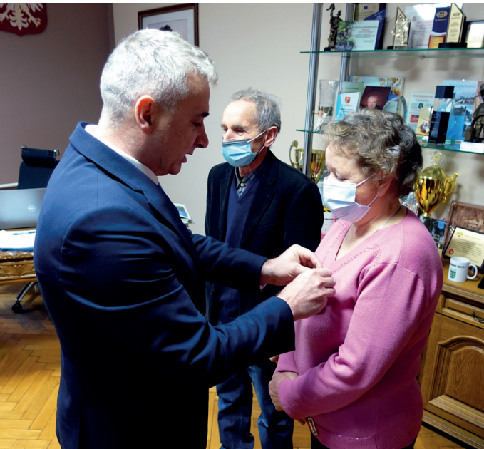
Uroczysty akt dekoracji Medalami za Długoletnie Pożycie Małżeńskie

Jubilatom życzymy zdrowia i pomyślności w życiu osobistym na dalsze lata pożycia małżeńskiego.