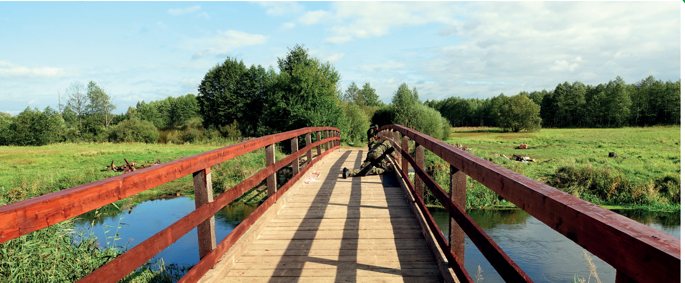
Żołnierze 3. Batalionu Drogowo-Mostowego z Chełmna wyremontowali przeprawę mostową w Raczku. Drewniana kładka na Drwęcy ponownie umożliwi mieszkańcom i turystom bezpieczne przejście na drugą stronę.