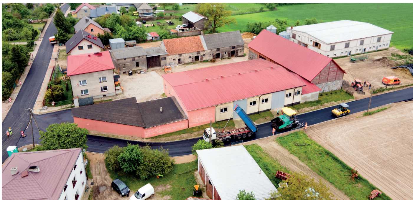
II etap przebudowy drogi gminnej Kołodziejki – Pomierki w miejscowości Pomierki - jedna z tegorocznych inwestycji zrealizowana przy wsparciu środków z rządowych dofinansowań.