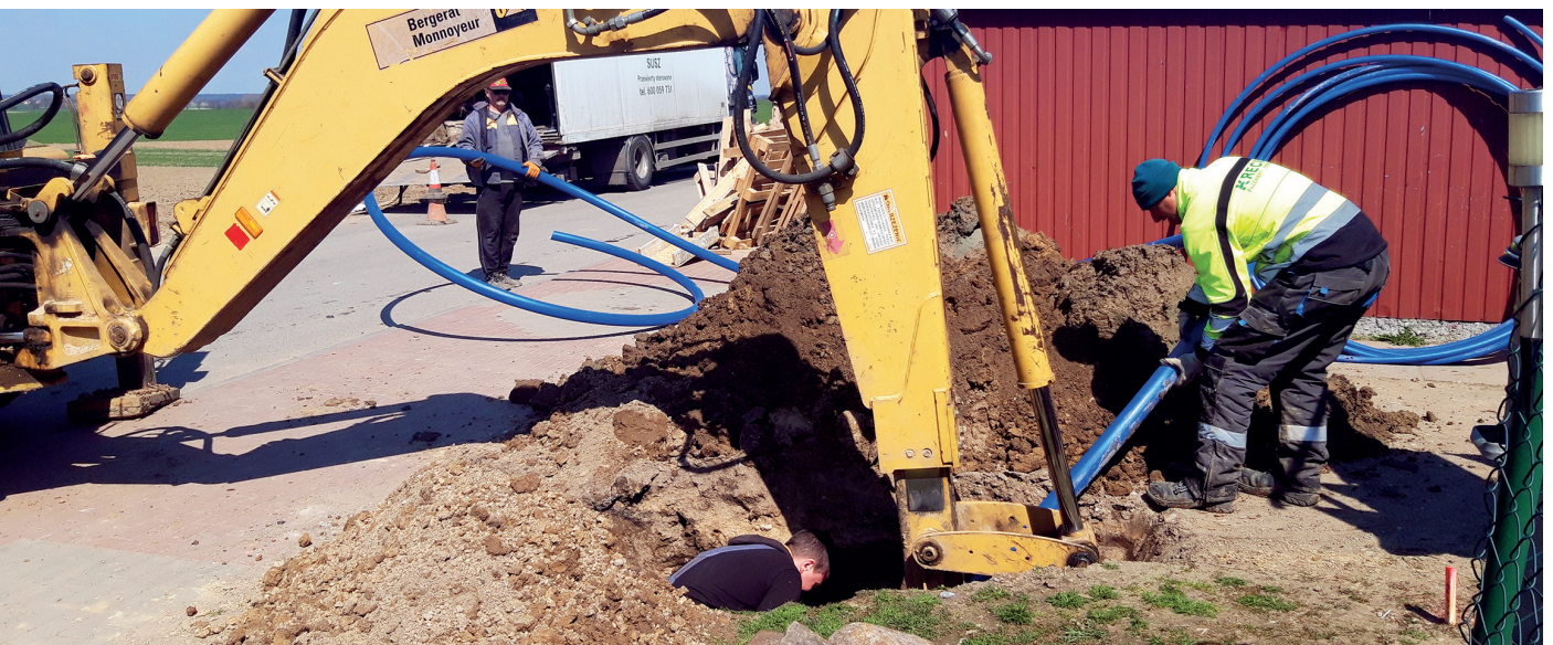
Budowa sieci kanalizacji sanitarnej wraz z przyłączami w Grabowie. Powstaje tu ponad pół kilometra sieci wodociągowej oraz ok. 9 km sieci kanalizacyjnej, do której zostanie podłączonych 68 nieruchomości. Realizacja zadania potrwa do listopada 2022 roku