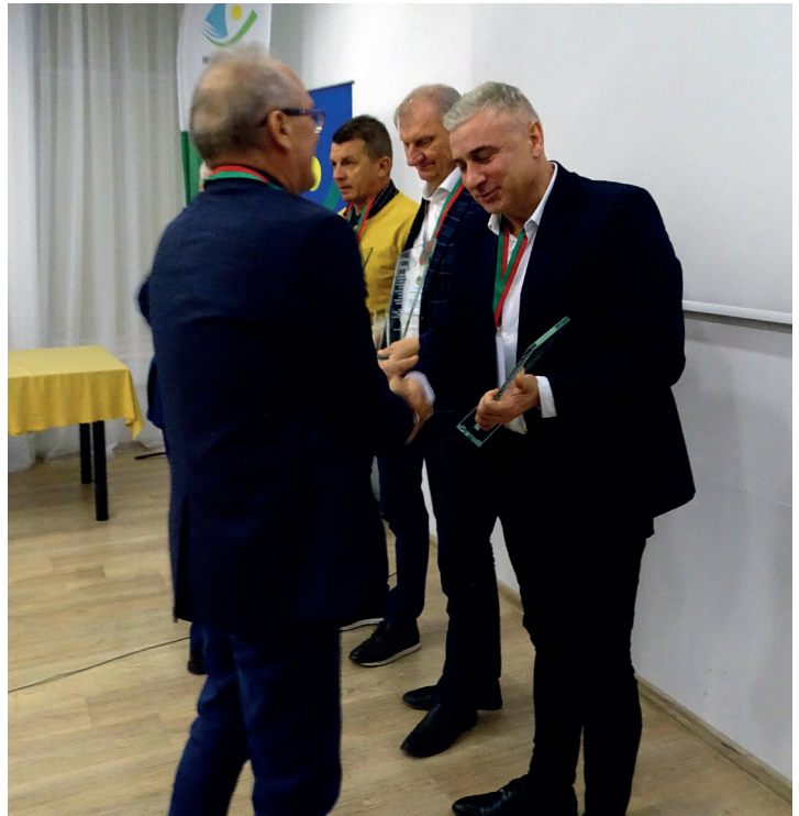
Wręczenie nagrody odbyło się 7 listopada w Sali Konferencyjnej Hotelu VillaPallas