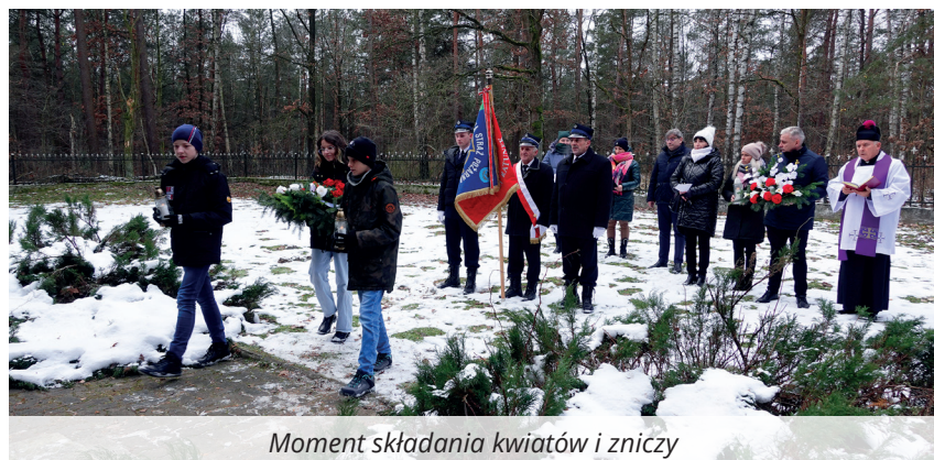
Moment składania kwiatów i zniczy

Zginęło wówczas dwadzieścia pięć osób, stąd ten dzień nazywamy „czarnym czwartkiem”.