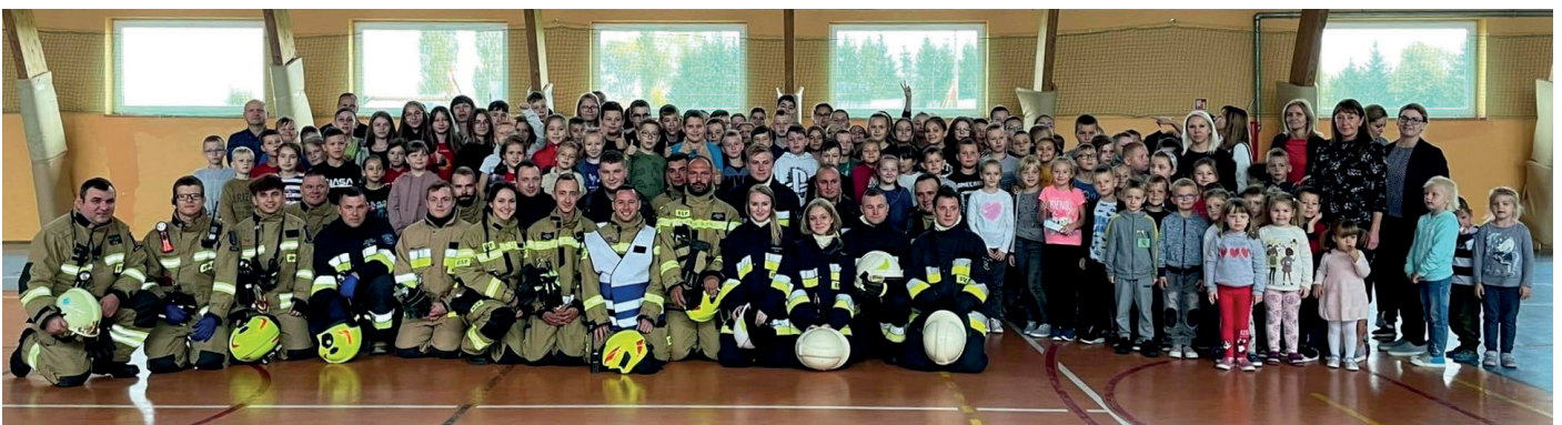
W październiku jednostki OSP Zielkowo, Rożental i Kazanice przeprowadziły próbną ewakuację Szkoły Podstawowej w Rożentalu. Była to okazja aby sprawdzić i doszlifować umiejętności w zakresie pożarów wewnętrznych

Październik. Sobota 16 października była dniem wyjątkowym dla jednostki OSP w Tuszewie, gdzie odbyła się uroczystość przekazania i poświęcenia nowego samochodu strażackiego. Szeregi jednostki zasilili lekki samochód specjalny, ratowniczo-gaśniczy VOLKSWAGEN CRAFTER 35, wyposażony m.in. w reflektory na podnośniku teleskopowym, pozwalające oświetlić miejsce akcji ratunkowej oraz inne nowoczesne systemy.