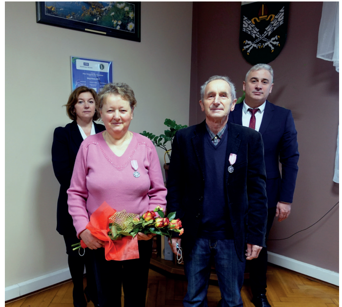
Pamiątkowe zdjęcie Jubilatów z wójtem oraz kierownik Urzędu Stanu Cywilnego