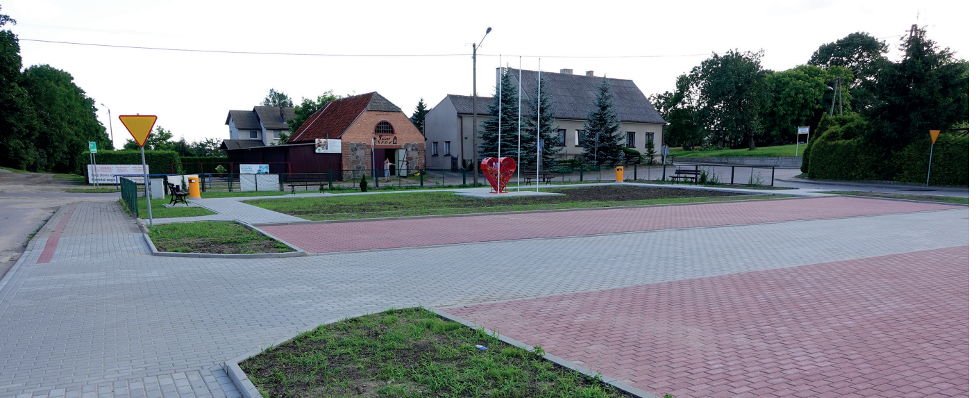
W Prątnicy przeprowadzony został remont chodnika na placu gminnym polegający na ułożeniu kostki betonowej na podbudowie piaskowo-betonowej. W efekcie powstał utwardzony plac o powierzchni 430 metrów kwadratowych.